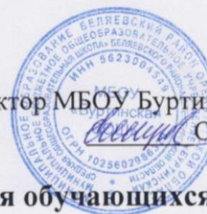
График организации питания обучающихся